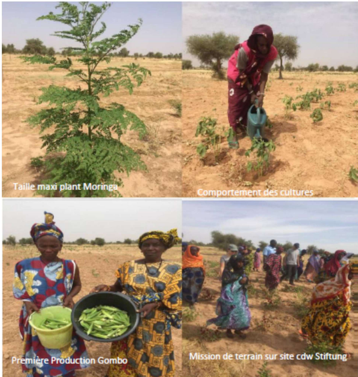
Abb. 4: Bewirtschaftung einer bisherigen Brachfläche Im Senegal

Bereits vor Gründung der Stiftung habe ich 2020 durch einen Finanzierungsbeitrag an die CDW Stiftung in Kassel 100 Bäuerinnen im Nord-Senegal, die mit Hilfe eine Solarpumpe eine bis dahin verwüstete Fläche von 10 Hektar bewirtschaften, mit einem Betrag von 10.000 € unterstützt.