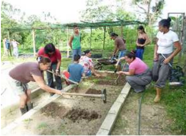
Abb. 6: Waldgärten in Venezuela