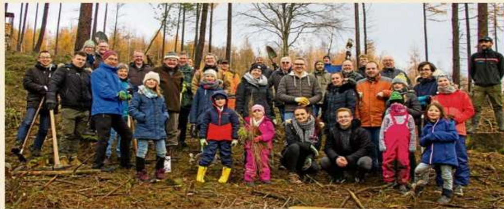
Abb. 8: Wiederaufforstung in Hagen

In Hagen hat die Stiftung über eine Baumspende über 5.000 € an den Rotary Club die Wiederaufforstungsbemühungen im Stadtwald Hagen unterstützt.