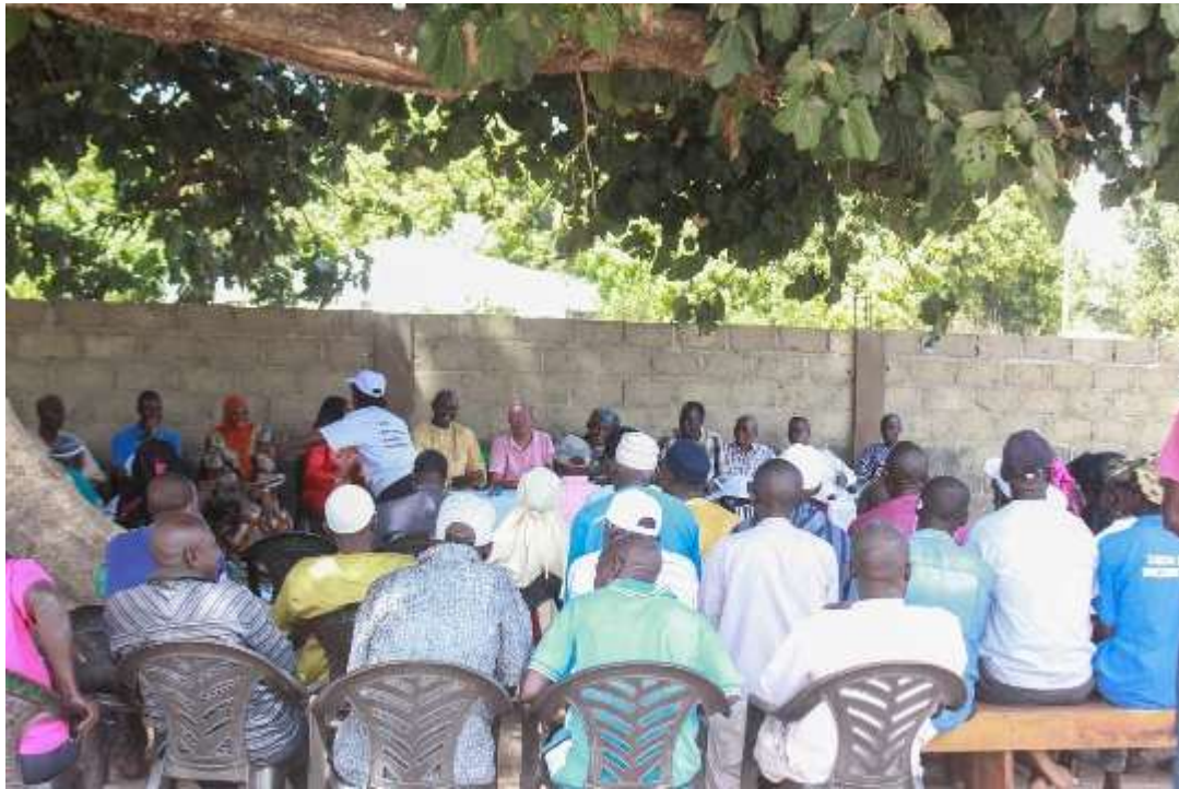
Abb. 22: Ansprache der Hasenritter Stiftung