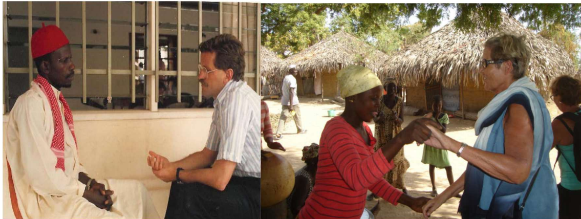
Abb. 3: Begegnungen in Sierra Leone und im Senegal

Die Menschen in Westafrika waren uns mit ihrer Fröhlichkeit und Herzlichkeit immer persönlich am nächsten. Natürlich kann es entsprechend dem Stiftungszweck auch andere Fördermaßnahmen und andere regionale Schwerpunkte auch in Europa und Deutschland geben. Die aktuelle Bedrohungslage für menschliche Entwicklung schätze ich wie folgt ein: Der Stellung der Frauen in den sich entwickelnden Gesellschaften kommt dabei eine Schlüsselrolle zu: Maßnahmen, die für Frauen Einkommen schaffen oder erhöhen, zugleich den Klimaschutz fördern bzw. sichern und ihre Qualifizierung verbessern, sollten eine hohe Priorität genießen.